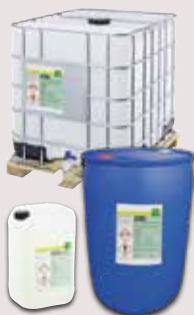
25 kg Kanister, 200 kg Fass, 1.000 kg Container