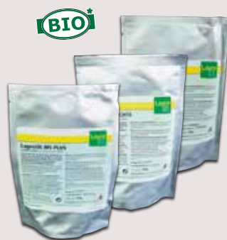
100 g Beutel Einsatz: 1 g pro Tonne Siliergut