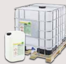
25 kg Kanister 1.000 kg Container