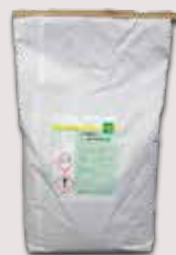
25 kg Sack