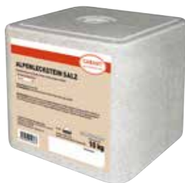
10 kg Block Art.Nr. 991.735