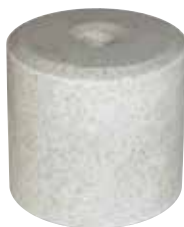
4 x 5 kg Block Art.Nr. 991.733