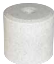
4 x 5 kg Block Art.Nr. 991.734