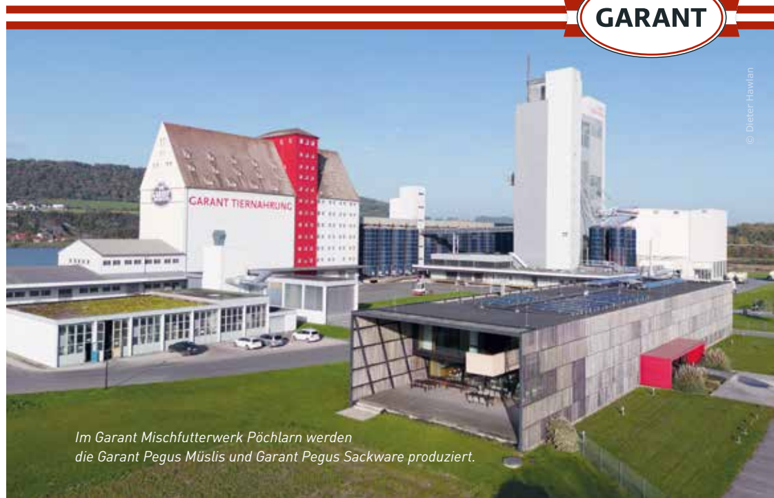
Im Garant Mischfutterwerk Pöchlarn werden die Garant Pegus Müslis und Garant Pegus Sackware produziert.